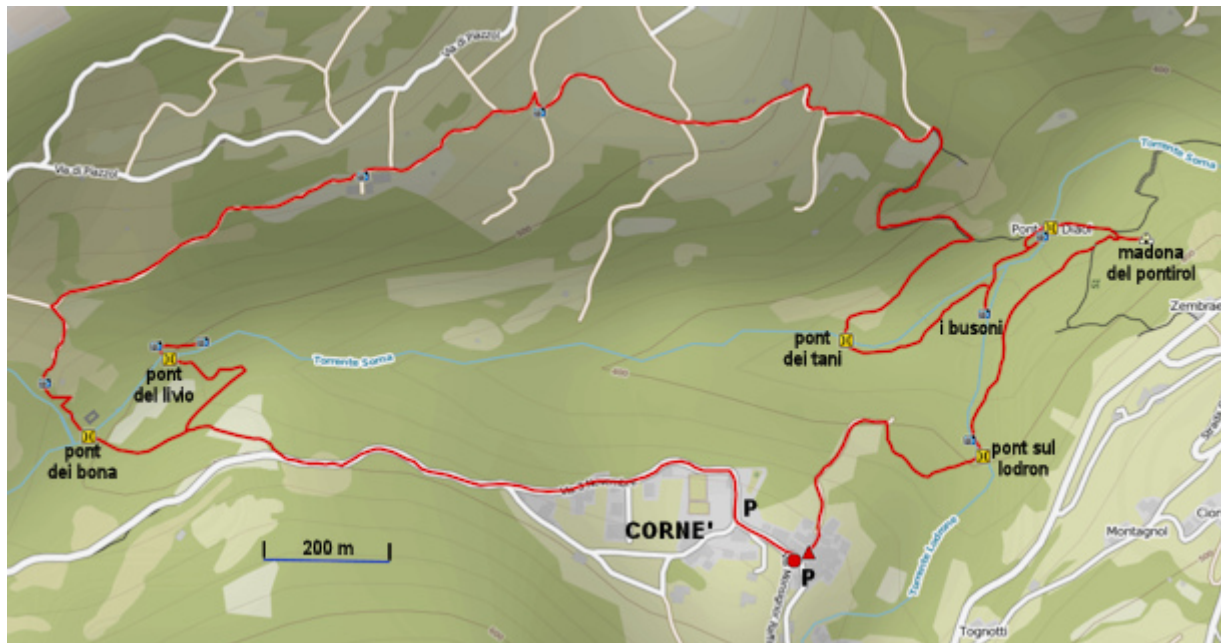
Map of trekking in the deep canyon of torrente Sorna - 5 BRIDGES ROUND TRIP